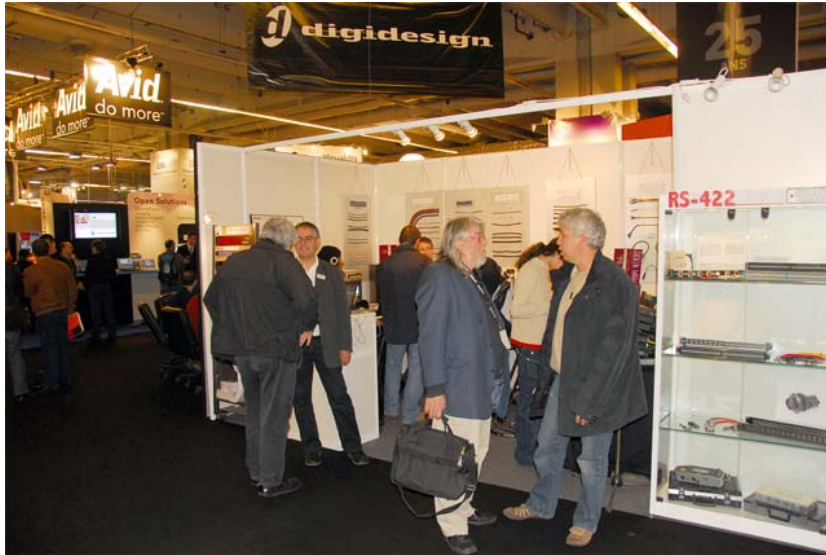
Busy people at the RS-422 booth. Interessierte Leute am RS-422-Messestand.