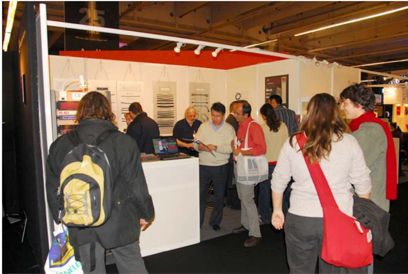
The RS-422 booth with lots of interested customers. Der RS-422-Messestand mit vielen interessierten Kunden.