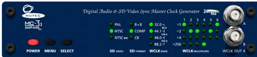
MC-3.1 SMART CLOCK SD, Front