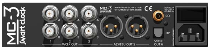
MC-3 SMART CLOCK, Rückseite