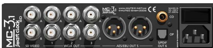
MC-3.1 SMART CLOCK SD, Rückseite