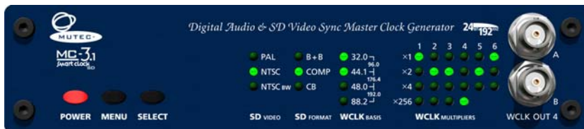
MC-3.1 SMART CLOCK SD, Front