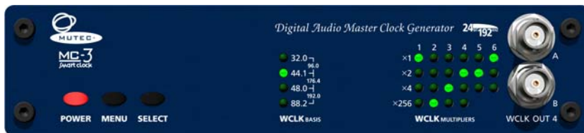
MC-3 SMART CLOCK, Front

Die neuen SMART CLOCKS sind universelle, Digital-Audio- und SD-Video-Master-Clock-Generatoren. Beide Geräte generieren Ultra-low-jitter-Taktsignale für die Synchronisierung verschiedener Audio- und SD-Videogeräte und bieten dabei eine große Anschlußvielfalt sowie ein neues, vereinfachtes Bedienungskonzept.