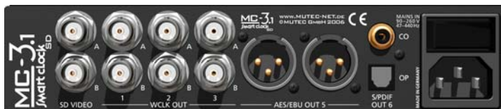
MC-3.1 SMART CLOCK SD, Rear