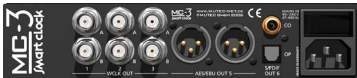
MC-3 SMART CLOCK, Rear